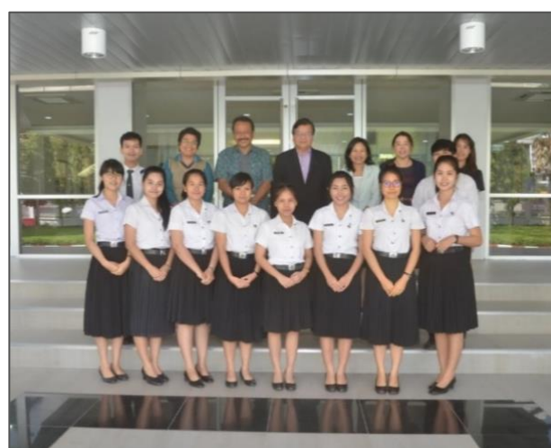
Photo 4. An Orientation at University of Makassar.