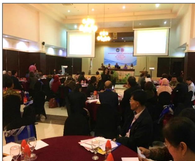
Photo 2. Meeting